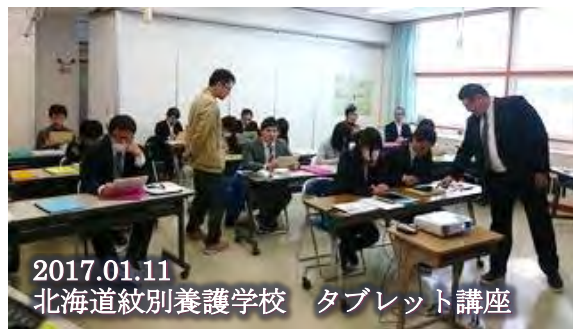
2017.01.11 北海道紋別養護学校 タブレット講座