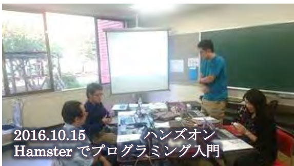
2016.10.15 ハンズオン Hamster でプログラミング入門