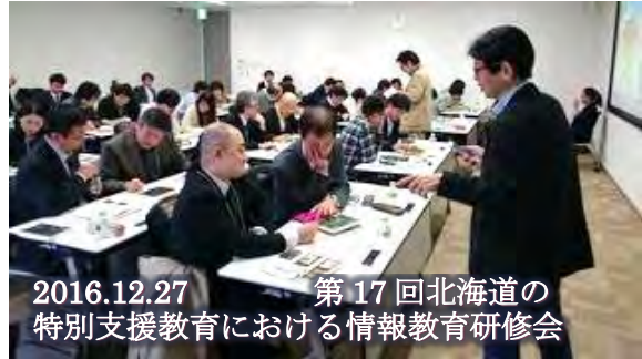
2016.12.27 第17回北海道の 特別支援教育における情報教育研修会