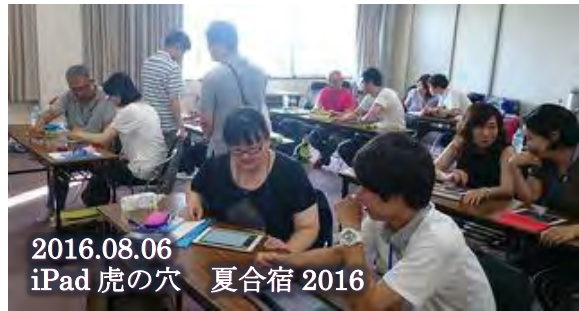
2016.08.06 iPad 虎の穴 夏合宿 2016