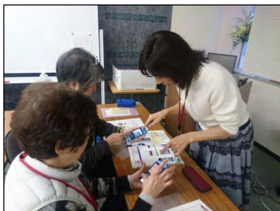
2016年11月シニアのためのスマホ講座