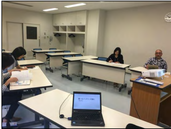
5月13日講師ミーティング