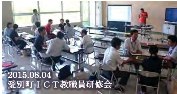
2015.08.04 愛別町 I C T教職員研修会