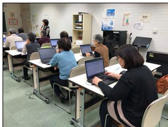
2017年2月手稲区民センターExcel講座