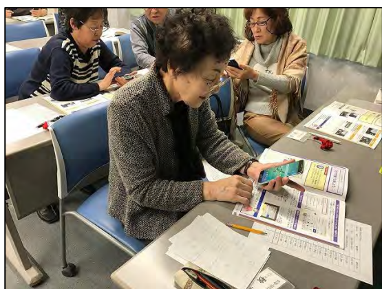
2017年10月トライパソコン