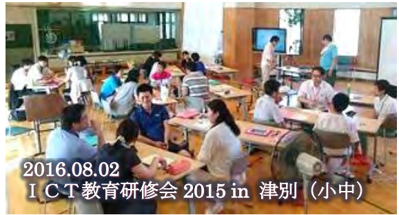
2016.08.02 I C T教育研修会 2015 in 津別 (小中)